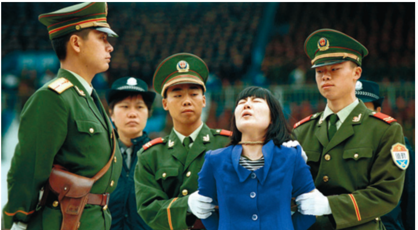
De Chinese vrouw schreeuwt wanneer ze de uitspraak doodstraf hoort; ze werd beschuldigd van moord op haar man, in de Chinese stad Guangzhou, op 11 april 2001

In het China van vóór de Culturele Revolutie was er al nauwelijks sprake van een onafhankelijke balie, tijdens de revolutie werd de hele professie afgeschaft. Ook het ministerie van Justitie en de juridische opleidingen werden gesloten. In een land waar een partij wetten maakt, uitlegt en uitvoert, bestaat immers geen behoefte aan onderzoek, noch aan een onafhankelijke balie.