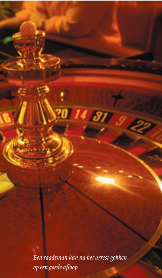
Een raadsman kán na het arrest gokken op een goede afloop

dering voorziene systeem van rechtsbijstand aan verdachten. Na uitvoerige citaten van (gedeelten van) de art. 38, 39, 41, 42 en 43 Sv en de art. 24, 31 en 44 van de Wet op de rechtsbijstand stelt de Hoge Raad vast dat met dat systeem niet verenigbaar is dat de raadsman die in een strafzaak aan de verdachte was toegevoegd, nadat de zaak is geëindigd alsnog als gekozen raadsman in de zin van genoemde bepalingen komt te gelden. Vervolgens stelt de Hoge Raad vast dat in het Wetboek van Strafvordering ook niet is voorzien in de mogelijkheid van een voorwaardelijke toevoeging in die zin, dat de toevoeging komt te vervallen indien de gewezen verdachte, nadat de zaak is geëindigd, in aanmerking komt voor toekenning van een vergoeding op de voet van art. 591a Sv. Daarna stelt de Hoge Raad zich de vraag of zo'n voorwaardelijke toevoeging gezien art. 31 van de Wet op de rechtsbijstand wel zou kunnen worden verstrekt.