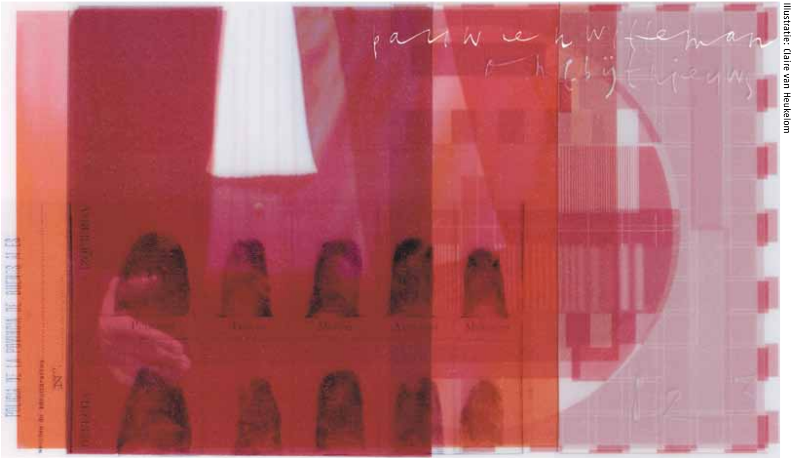
Illustratie: Claire van Heukelom

Dus het komt in belangrijke mate neer op de advocaat. Je moet het alleen doen als je vindt dat je iets te zeggen hebt, of als je denkt dat je daarmee een te eenzijdig beeld in de pers kunt voorkomen. Waar je beducht op moet zijn, is het element van ijdelheid dat kan meespelen. Mensen vinden het toch mooi om in de krant te komen. Dat mag, iedereen is ijdel, ik ook. Maar het mag niet het motief zijn, het moet wel ergens over gaan.'