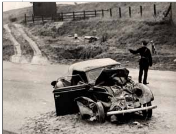
Bernhard wilde in 1937 na een crash de andere bestuurder een proces aandoen. Wilhelmina verbood het.