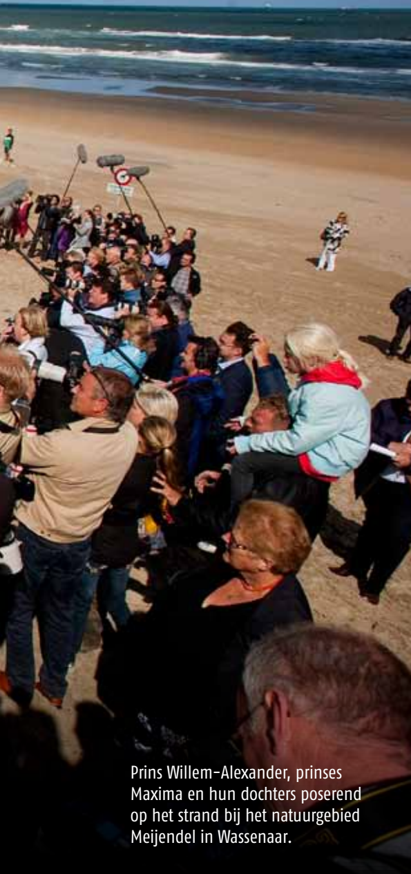
Prins Willem-Alexander, prinses Maxima en hun dochters poserend op het strand bij het natuurgebied Meijendel in Wassenaar.

houden met de constitutionele monarchie, maar hij had het geluk dat rechters in die tijd erg op de hand van de Oranjes waren. Wie bijvoorbeeld kwaad over hen sprak, kon op fikse straffen rekenen. En onder Koning Willem III (1817-1890) was dat niet veel anders. Willem III draaide dan ook zijn hand niet om voor het laten vervolgen door Justitie van de wegens het opkomende socialisme vele majesteitschenners. Zo werd de sociaal-anarchist en dominee Ferdinand Domela Nieuwenhuis veroordeeld tot een halfjaar celstraf. Niet voor niets kreeg Willem III de bijnaam Koning Gorilla.