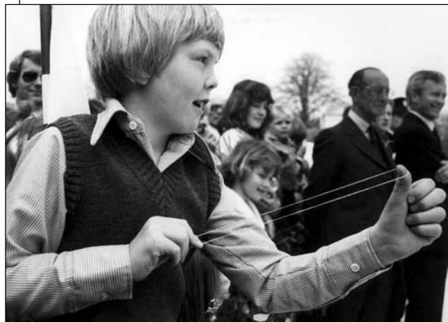
Tijdens het defilé op Koninginnedag 1978 op Paleis Soestdijk schiet prins Willem-Alexander met elastiekjes op voorbijgangers.