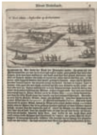
Pagina uit 'Beschryvinge van Nieuw Nederland'

Generaal gericht Vertoogh protesteerden de inwoners tegen de omstandigheden in de door de West-Indische Compagnie geleide kolonie en eisten zij het aftreden van gouverneur Stuyvesant. Goed beschouwd betrof het de eerste poging van de 'Amerikaanse' koloniale bevolking om bij wijze van petitie hun grieven rechtstreeks aan de hoogste overheid voor te leggen – anderhalve eeuw voordat dat recht via de Bill of Rights in de Amerikaanse constitutie werd verankerd. Ondanks tegenwerking van Stuyvesant – hij trachtte Van der Donck als verrader veroordeeld te krijgen – pleitte een delegatie onder aanvoering van Van der Donck er eind 1649 in Den Haag voor om het regime van de WIC te vervangen door koloniaal zelfbestuur. In afwachting van de beslissing van de Staten-Generaal werkte Van der Donck intussen verder aan zijn Beschryvinge van Nieuw Nederland , de eerste uitvoerige optekening van de kolonie, waarmee hij Nieuw-Amsterdam letterlijk op de kaart zette. Door onder meer deze Beschryvinge en zijn politiek activisme leek Van der Donck het pleit in zijn voordeel te beslechten. De Staten kwamen tot de conclusie dat