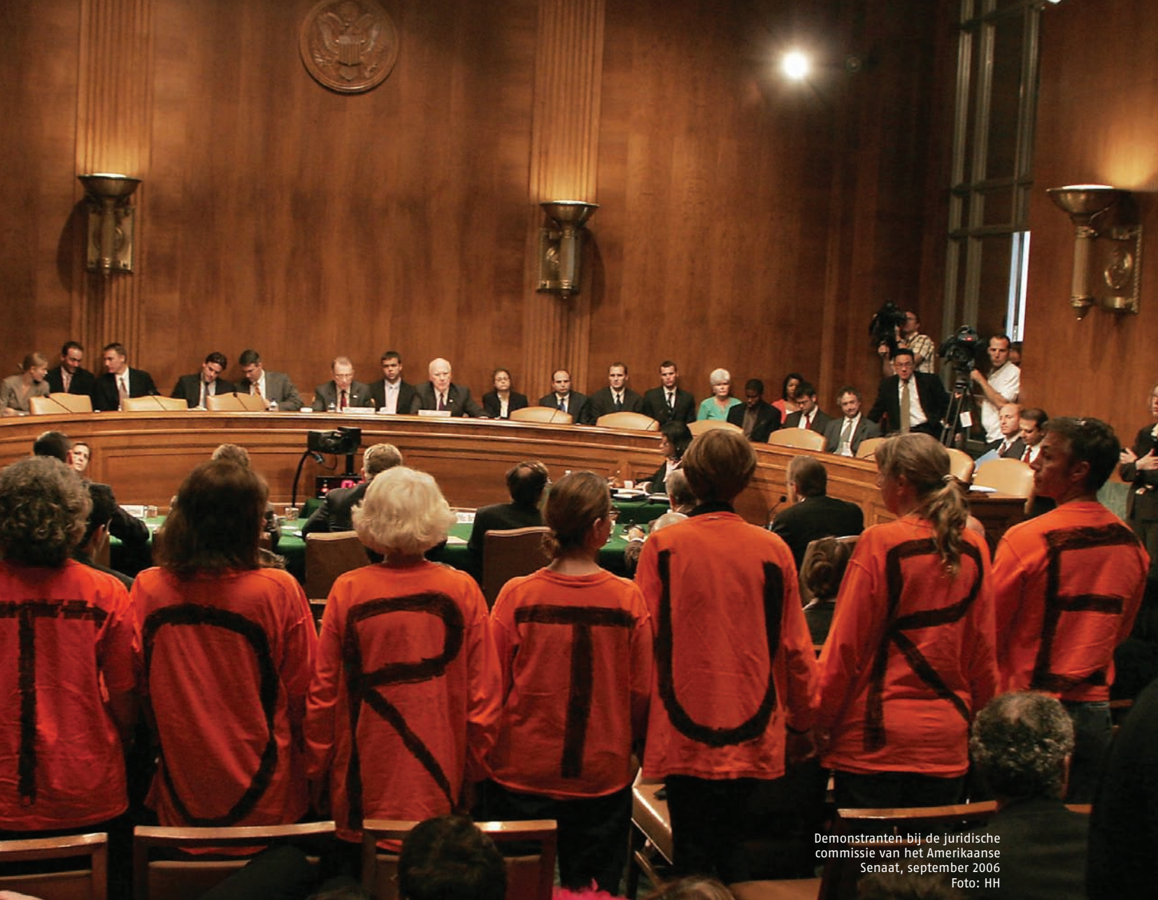
Demonstranten bij de juridische commissie van het Amerikaanse Senaat, september 2006

mands nor is accustomed to it. Much salesmanship is required. It is for this reason that it is simply impossible for the Western countries, who purport to adhere as closely as possible to the Rule of Law, to persuade others to join them if they can be shown in fact only to adhere to their own principles when it suits them.