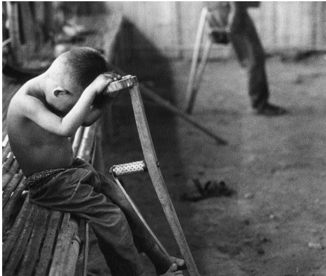
Cambodja, 1987; kind en landmijnslachtoffer in ruimte voor fysiotherapie

legal consultant bij Legal Aid of Cambodia in Phnom Penh