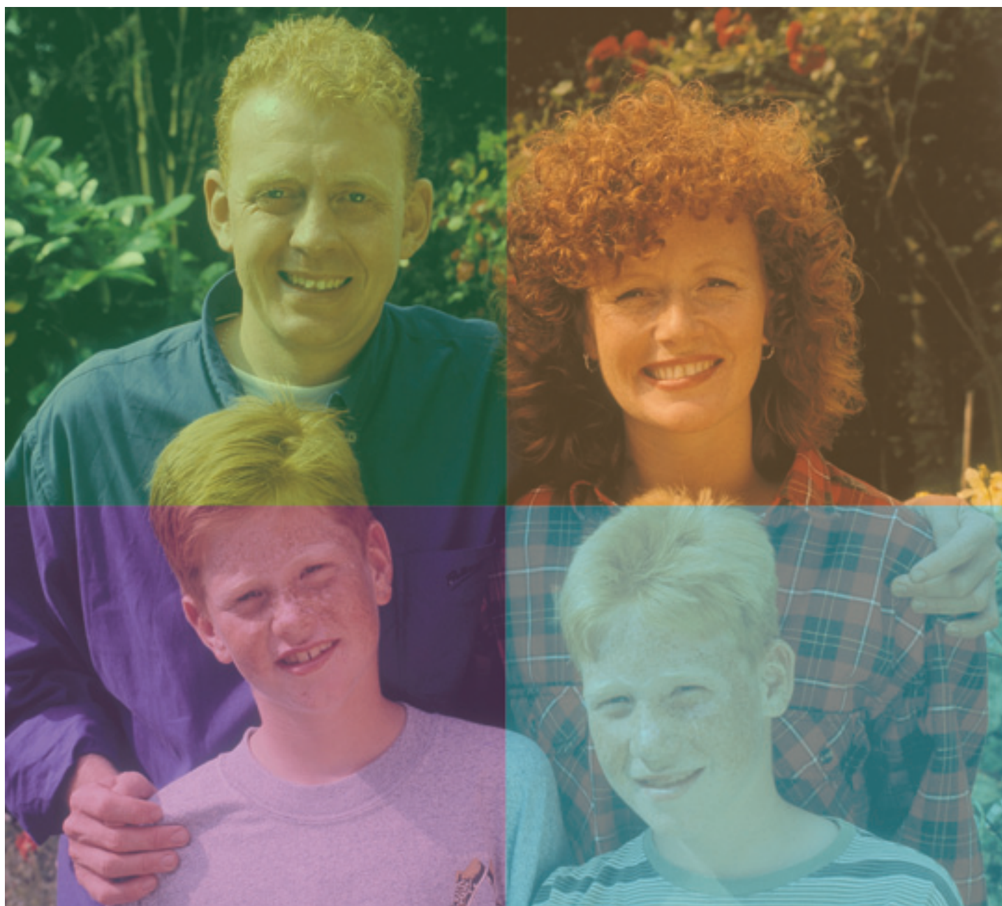
Illustratie: Andre Kluijzen

Op 1 januari van 2003 is het nieuwe erfrecht in werking getreden. In dit artikel wordt ingegaan op de door dat nieuwe erfrecht geïntroduceerde wettelijke verdeling en de wilsrechten van kinderen. Dit nieuwe erfrecht, dat juist voor gezinnen ingrijpende wijzigingen meebrengt, wordt toegelicht aan de hand van een casus.