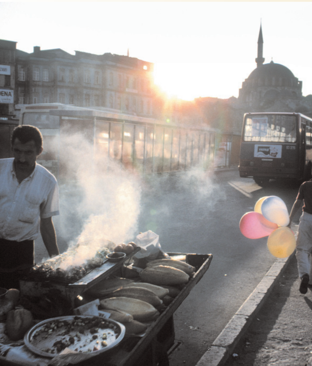
Straathandel in Istanboel, 2000

'Ik bezoek bijvoorbeeld regelmatig de bedrijven van wie mijn cliënten geld te goed hebben', legt hij uit. 'Incassozaken in Turkije begin ik bij voorkeur op die manier. Debiteuren stellen betalen eindeloos uit, omdat de rente hoog is of omdat ze zelf nog vorderingen op anderen hebben. In een persoonlijk gesprek probeer ik ze te overtuigen mee te werken aan een afbetalingsregeling.' Meestal heeft die werkwijze succes. 'Al duurt het soms maanden voordat er een regeling is getroffen en uitgevoerd. Maar dan nog is een schikking beter dan een rechtszaak die zich