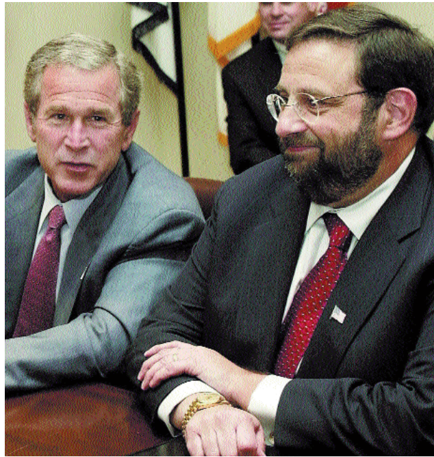
Voorzitter van SEC, Harvey Pitt, sprak op 12 juli jl. met een politicus