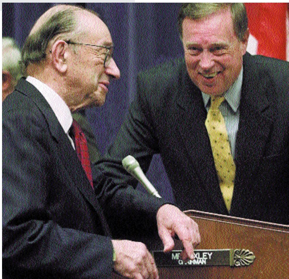
Republikeins senator Mike Oxley praat met Alan Greenspan van de federale bank

In de voorstellen wordt de gedragscode ingrijpend aangepast om, zo schrijft de werkgroep in haar rapport, 'advocaten te helpen hun plicht te vervullen (...) in geval-