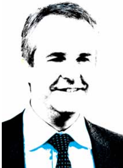
..... Bernard Roelvink: