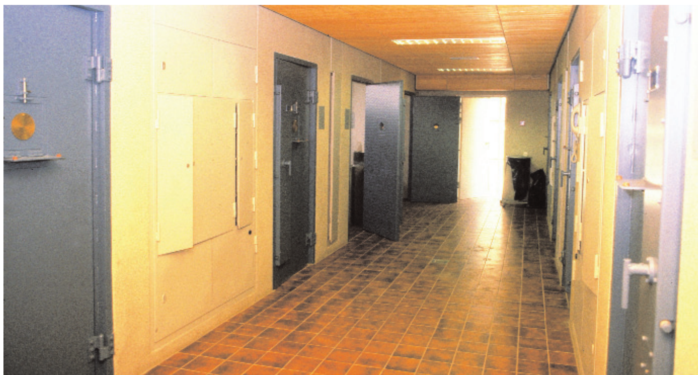
Nieuwe cellen op het hoofdbureau van de politie in Amsterdam

caten kan dan ook de aandacht krijgen die ze verdient, wat nu helaas niet altijd het geval lijkt. Als rechtsbijstand aan arrestanten serieus wordt genomen, dan moeten de advocaten ook een zodanige plaats krijgen in de arrestantenafdelingen van de politie, dat ze direct tot hun cliënt worden toegelaten en er niet vele uren wachtend moeten doorbrengen. ●