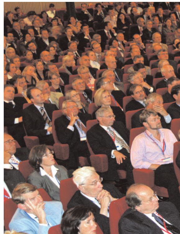
De achterban was de volgende dag bijeen op de Ordevergadering, ook in Zwolle

Sommige afgevaardigden worden wat duizelig van alle varianten. De pendule slaat vier keer en zoetjes-