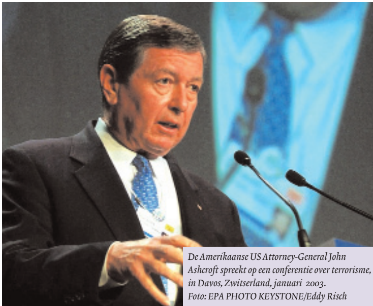
De Amerikaanse US Attorney-General John Ashcroft spreekt op een conferentie over terrorisme, in Davos, Zwitserland, januari 2003.