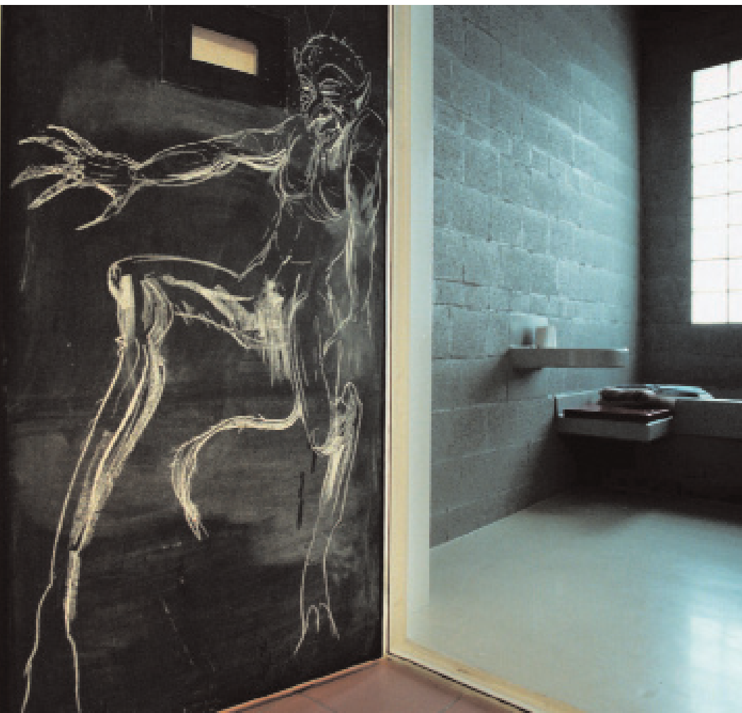
Politiecel in Delft

De termijnen van het strafpiketprotocol Rotterdam worden vaak niet gehaald, zeggen wetenschappers die een week alle zaken observeerden. Bij de rechtsbijstand op het politiebureau ontstaat de vertraging door de slechte communicatie tussen piketcentrale, politie en piketadvocaten. In bijna de helft van de zaken bezocht de advocaat de verdachte niet binnen vier uur. De piketcentrale klaagt dat dienstdoende piketadvocaten zich zeker na werktijd en in het weekend niet altijd van 9 tot 21 uur beschikbaar houden. Advocaten ergeren zich eraan dat de politie hen niet informeert over de oorzaak van de wachttijden. De onderzoekers rekenen op vooruitgang als er tussen de betrokken partijen direct (telefoon)contact mogelijk wordt en als de piketvoorzieningen gaan werken vanaf de aanhouding.