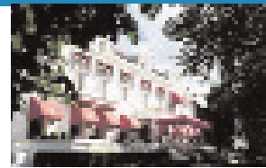
Hotel Wientjes, Zwolle

Letselschadeadvocaat J. Beer (Amsterdam) denkt dat dit onderscheid tussen willen en kunnen niet te maken is. 'Laten we niet in die val lopen. Als je echt wil onderscheiden tussen willen en kunnen, moet je kijken naar de omstandigheden van de cliënt en