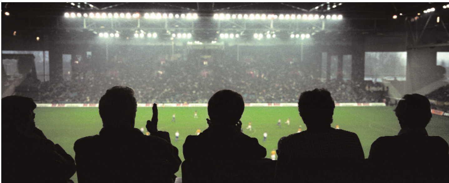
Arnhem, 13-11-2002; Voetbalwedstrijd Vitesse-Heerenveen, toeschouwers in het Gelredome, ouderen, sport, supporters, kijkers, publiek, stadion, voetbal. NIET VOOR PUBLIKATIE IN AD, TROUW, PAROOL, NRC EN/OF TELEGRAAF.

Overheden dienen de plannen voor steun aan te melden bij de Europese Commissie, 3 die vervolgens oordeelt of de voorgestelde maatregelen inderdaad als staatssteun zijn te beschouwen en als dit het geval is, in hoever-