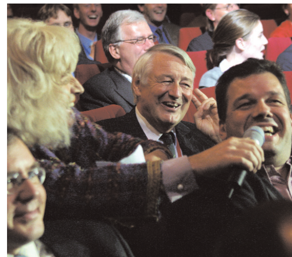
Dolman interviewt de zaal

'Ik ga nu zwemmen', teken ik op uit zijn mond – tijd voor uw verslaggever om na een zeer geslaagde middag het droge op te zoeken. ●