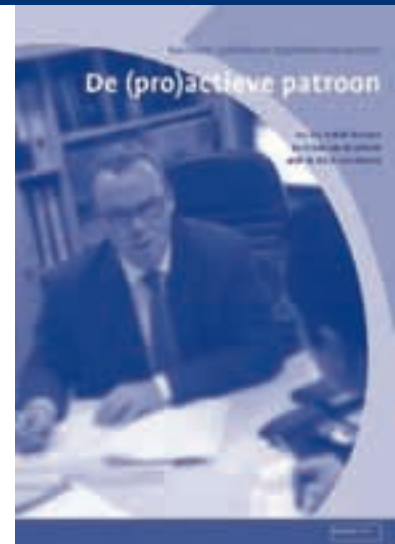
De (pro)actieve patroon (€ 29,95)