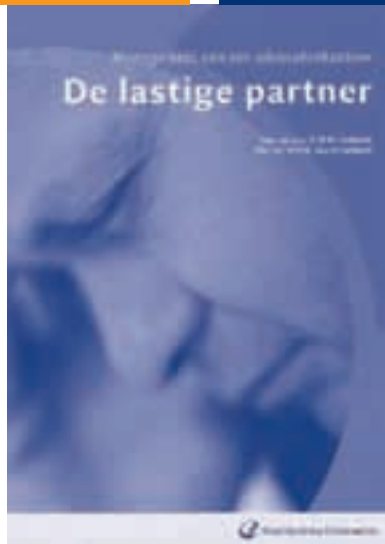
De lastige partner (€ 30,65)