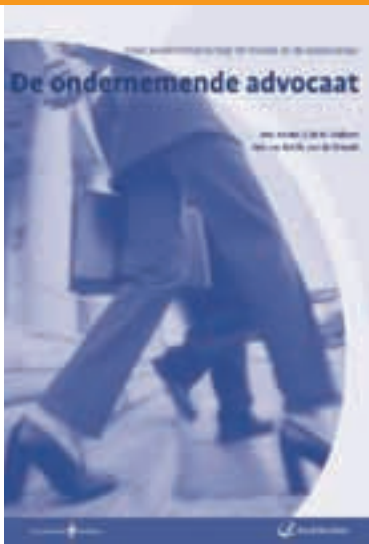
De ondernemende advocaat (€ 30,90)