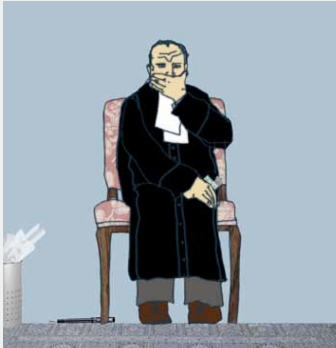
Illustratie: Floris Tilanus

Dwars daar doorheen opereren advocaten. Ze vormen een verzameling van saaie, uitbundige, vitale, luie, creatieve, toegewijde, ijdele, consciëntieuze, intelligente, gemakzuchtige, theatrale, zorgzame, commerciële, chaotische, aarzelende belangenbehartigers. De advocatuur in het algemeen heeft iets van een risicovolle belegging: hij schiet alle kanten op. Of: