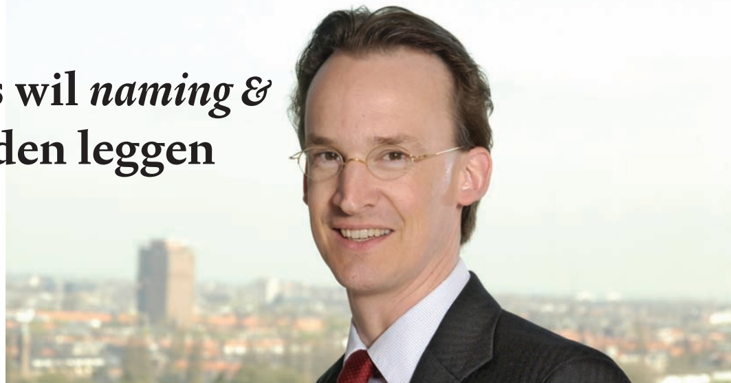
Toezichthouders zouden alleen de publiciteit moeten zoeken bij een zware overtreding of acuut gevaar voor het publiek

Zo terughoudend als de strafrechter is, zo gretig zijn de toezichthouders en handhavers. De