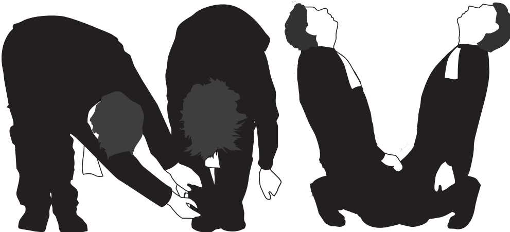
Illustratie: Dimitry de Bruin

Een huurschuld kan bij een groot kantoorgebouw oplopen tot aardige bedragen, maar hoe vaak komt het nou voor dat het kantoor de huur niet kan voldoen? Is beroepsaansprakelijkheid dan iets om echt bang voor te zijn? De Orde verplicht de kantoren om zich tegen beroepsaansprakelijkheid te verzekeren, tot een bedrag van bijna een half miljoen euro per advocaat en per gebeurtenis (en twee van deze gebeurtenissen per verzekeringsjaar). Zou een