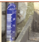
Omslag: NAP peilschaal bij Gouda.

748 Tijdens een kort-gedingprocedure is een uitgebreide voorbereiding van deugdelijke verweren nauwelijks mogelijk. Verweren dienen echter wel zo gemotiveerd en onderbouwd mogelijk te worden gevoerd. Enkele mogelijke verweren zijn op een rij gezet voor wie in tijdnood zit.