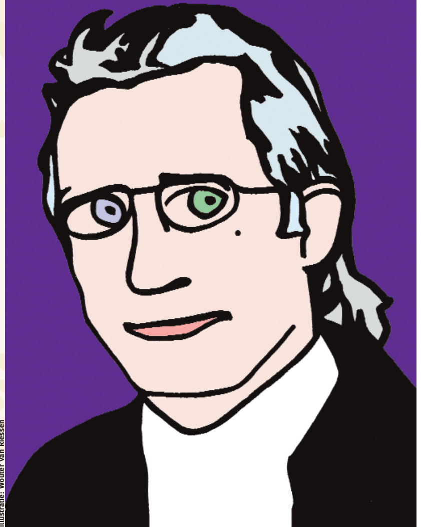
Illustratie: Wouter van Riesen

Voor het eerst sinds jaren iemand die niet inwisselbaar was.