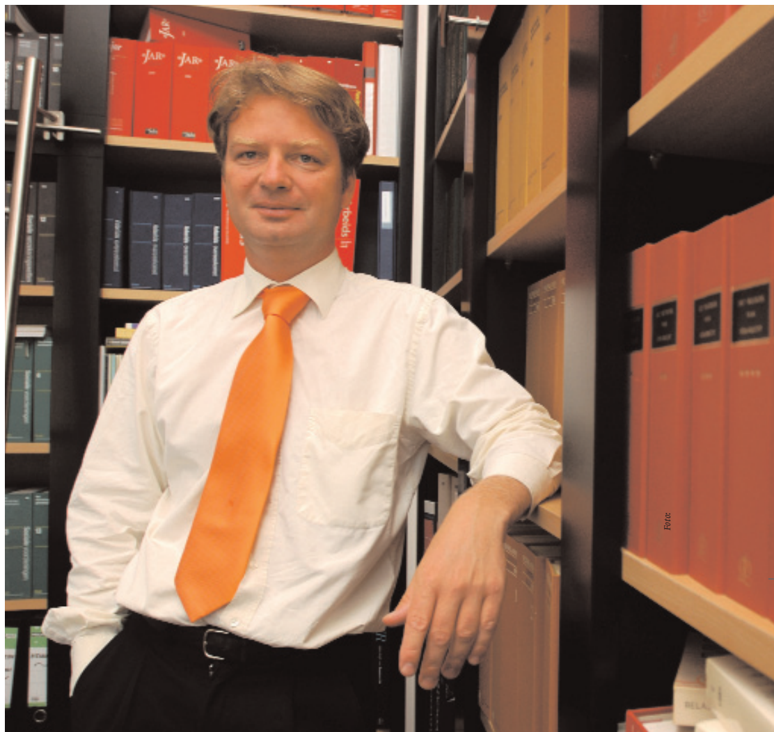
'De rechtlijnigheid in het marxisme sprak mij inderdaad wel aan'

Op mijn zeventiende raakte ik marxistisch georiënteerd. Ik was altijd begaan met het lot van de zwakkeren. In de kerk hoorde ik nooit iets pro-arbeider. Na school kwam ik in een kraakpand terecht. Nou, dan is het met je geloof snel afgelopen. Voor mijn