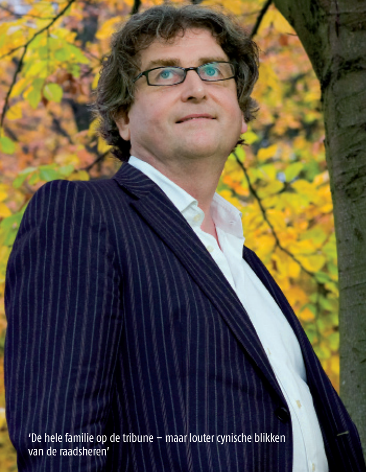
'De hele familie op de tribune – maar louter cynische blikken van de raadsheren'

Hoe liepen de zaken die ten grondslag lagen aan wat later mijlpalen in de jurisprudentie werden? We kijken terug met de advocaat van toen.