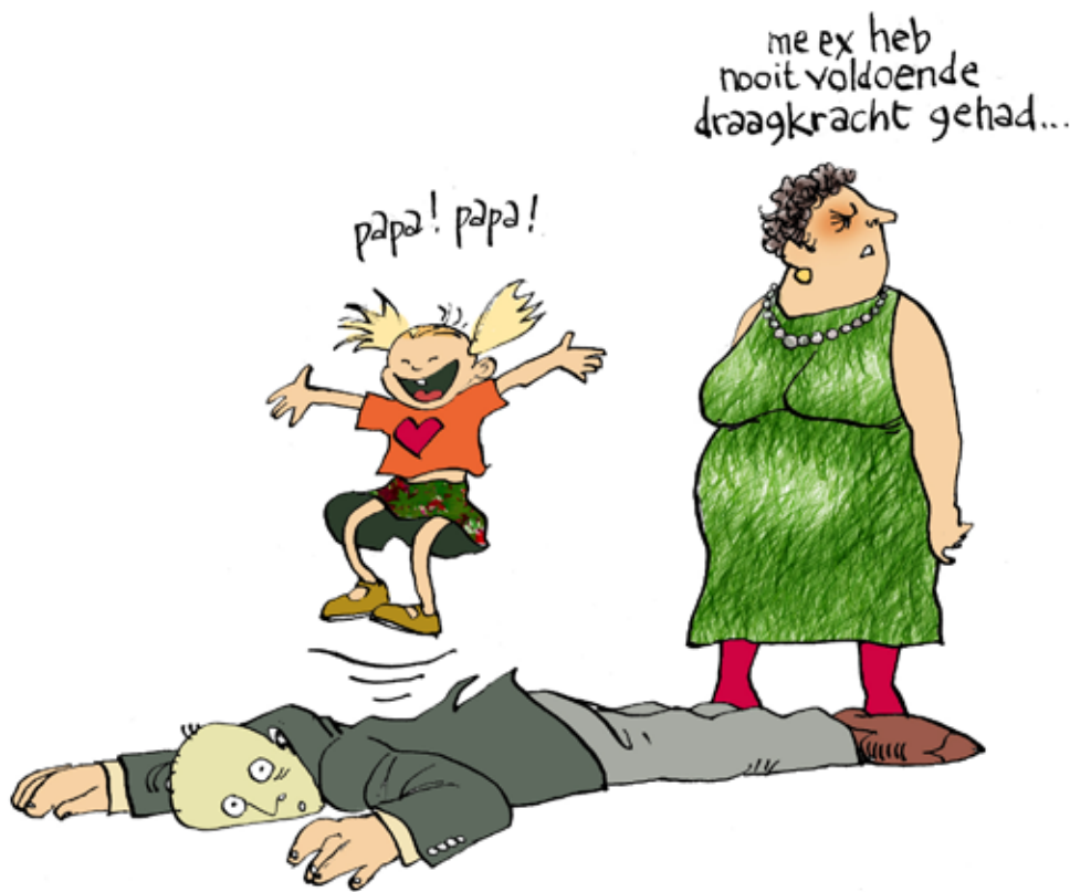
Illustraties: Floris Tilanus

Deze kroniek bevat een overzicht van de ontwikkelingen op het terrein van het personen- en familierecht tussen 1 oktober 2011 en 30 september 2012