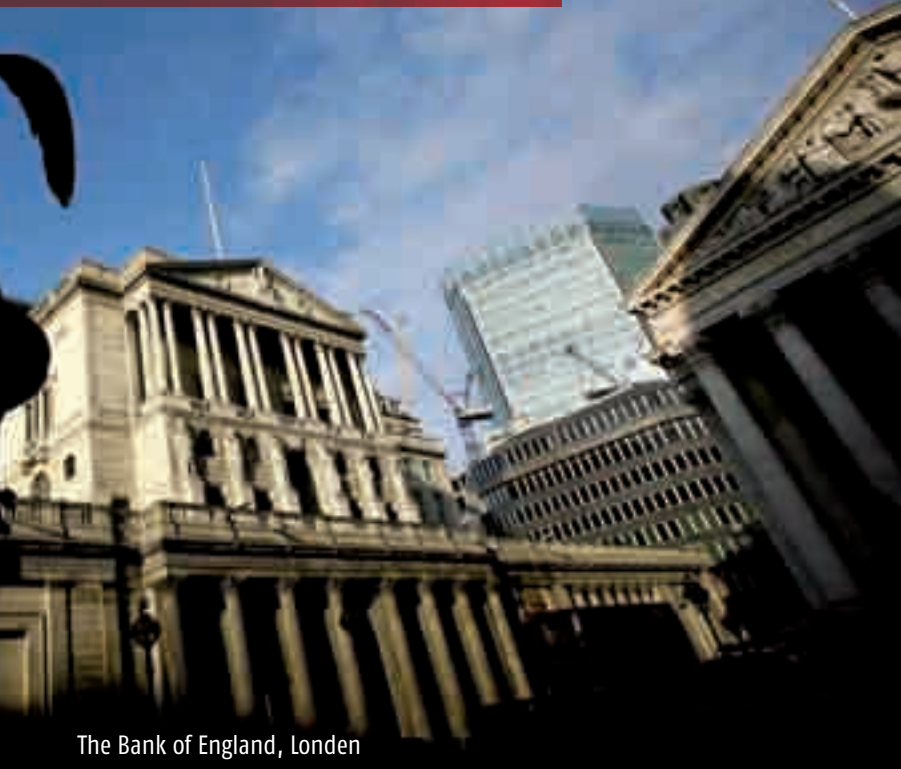
The Bank of England, Londen

‘De Britten lopen altijd een paar maanden achter de Amerikanen aan. En de advocatuur altijd achter andere beroepsgroepen.’