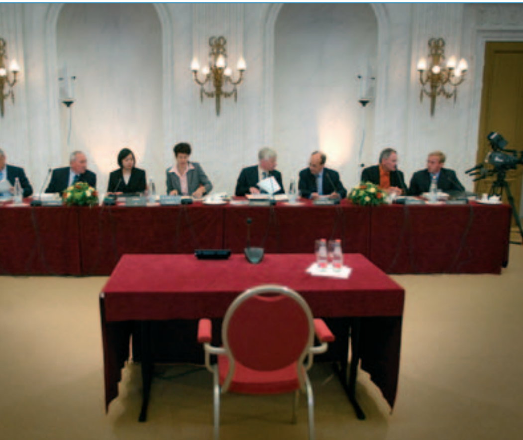
Den Haag, 22 augustus 2002, de eerste dag van de openbare verhoren door de enquêtecommissie bouwrijverheid.