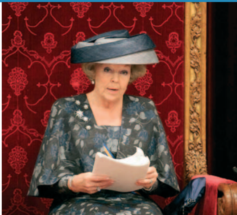
Koningin Beatrix tijdens Prinsjesdag 2004

Verder staat de inwerkingtreding van de nieuwe openbare voorbereidingsprocedure (bij bijvoorbeeld milieuvergunningen en bestemmingsplannen) in de planning voor begin volgend jaar. Ook wordt het met ingang van 1