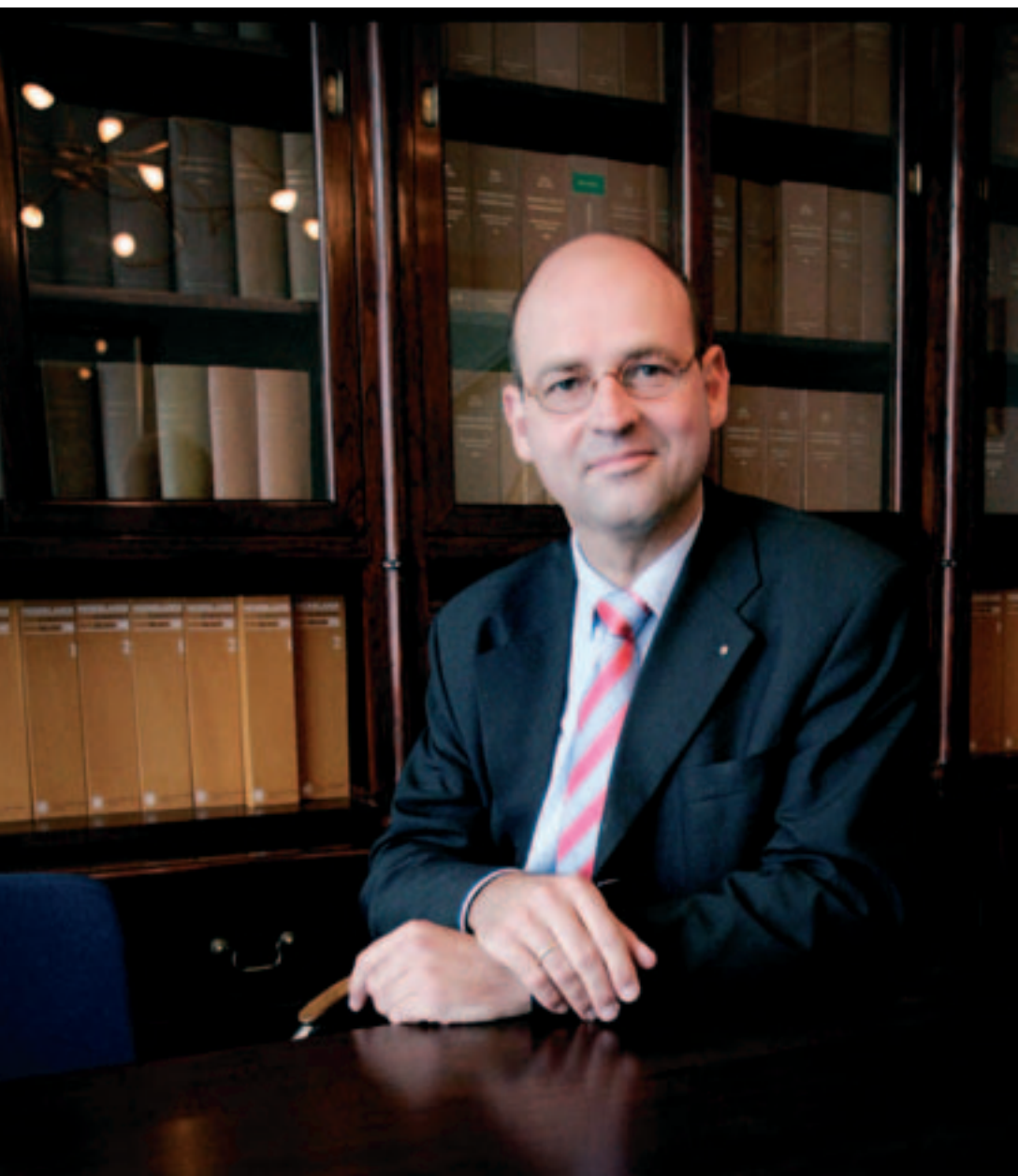
'Door de eeuwen heen staan we kennelijk bekend als schrapers'