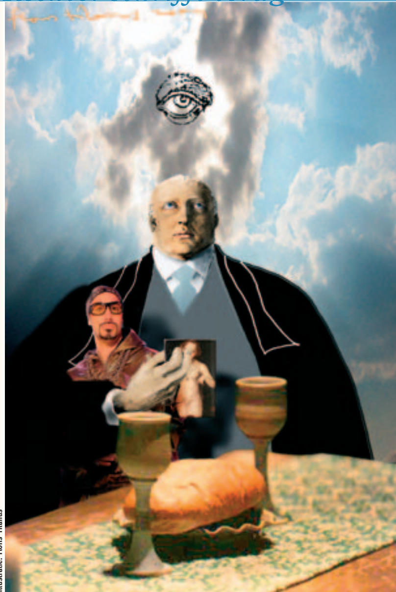
illustratie: Floris Tilanus

Toen ik mijn leedwezen uitsprak over het lange wachten, wilde mr. Ten Doeschot daar niets van weten. Hij had de tijd gebruikt om in alle