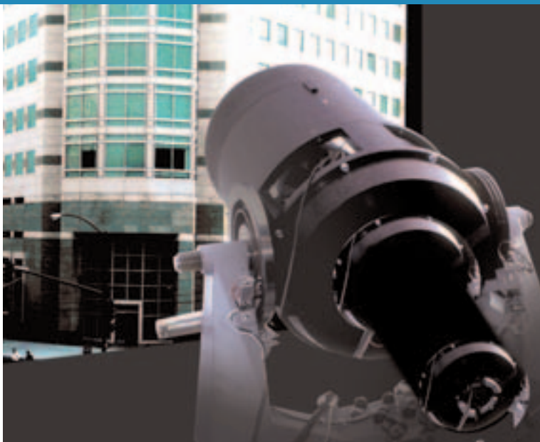
Illustratie: Dmitry de Bruin

Het aantal claims als gevolg van beroepsfouten en nalatigheden is sinds 1990 met 60% gestegen. Het percentage werd genoemd op een symposium over beroepsaansprakelijkheid van juridische beroepen dat verzekeraar AON 10 september jl. in Amsterdam organiseerde. Als oorzaken kwamen ter sprake: juridisering, claimbereidheid, drukte op kleinere kantoren, toegenomen macht van de Consumentenbond en ook de bewijslast ten nadele van de professional. Hoe dan ook, de verzekeringspremies nemen toe.