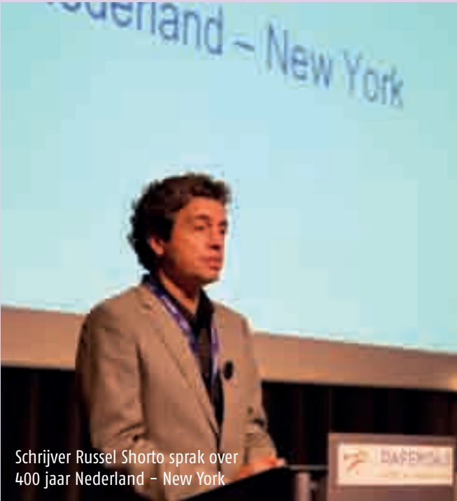
Schrijver Russel Shorto sprak over 400 jaar Nederland - New York