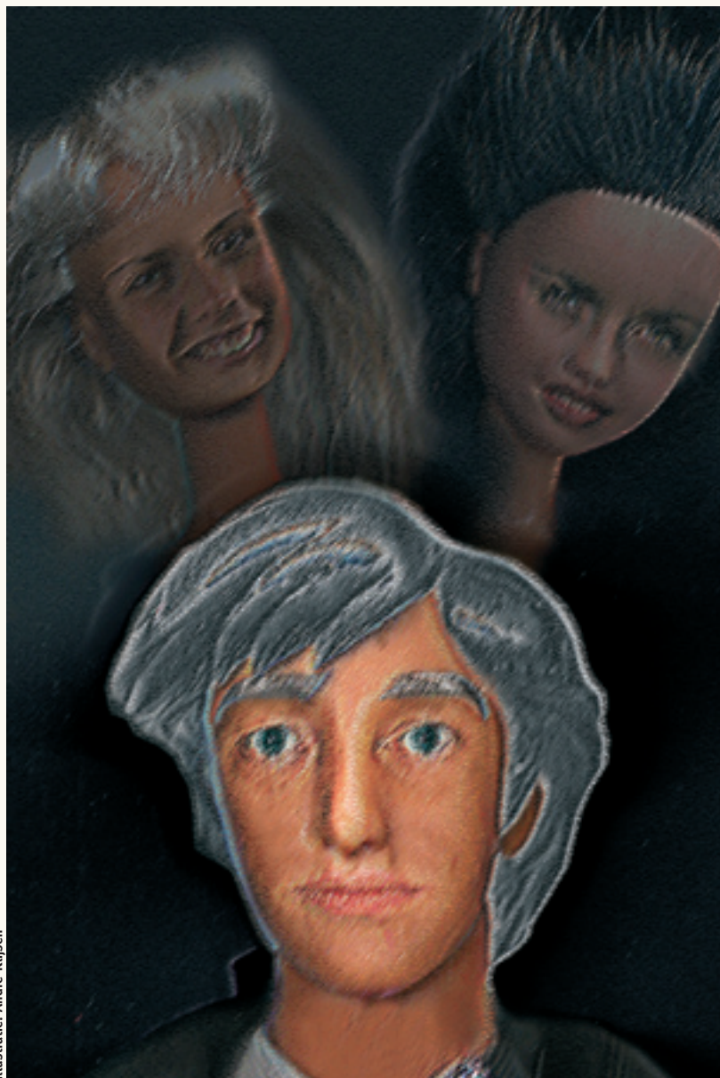
illustratie: Andre Kljisen

Bij het requisitoir komt de officier terug op de gewraakte zin. Het is één van haar eerste zittingen en nu pas wordt duidelijk hoe gekwetst ze is. Ze heeft de hele zitting gewacht en geworsteld met haar protest, maar nu ze er eenmaal lucht aan geeft, hakkelt ze van woede.