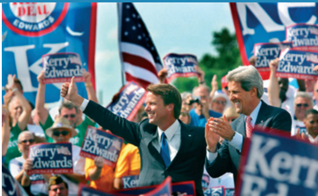
John Edwards en John Kerry

standaarden, niet veel meer dan tweedehands-autoverkopers. Bij grote delen van de bevolking geldt 'advocaat' als een half scheldwoord.