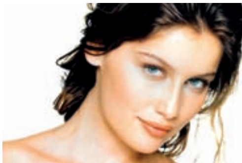
Laetitia Casta, model voor de Franse Marianne

De Franse advocatuur bestaat uit vijftigduizend advocaten, die verdeeld zijn over 182 balies, verenigd in de Conseil National des Barreaux (CNB). Een groot deel van de advocaten is eenpitter. De CNB probeert schaalvergroting en samengaan in associaties te bevorderen, vanwege de kwaliteit en de mogelijkheid tot specialisatie, maar niet in de laatste plaats omdat advocaten in grotere verbanden meer verdienen. Het gemiddelde inkomen van de Franse advocaat schommelt de laatste jaren rond de € 70.000. Maar voor de helft van de advocaten is het minder dan € 42.000, en voor een kwart van advocaten zelfs minder dan € 25.000. Veel van de armere advocaten werken op toevoegingsbasis in de provincie en doen relatief meer in de proces- dan in de