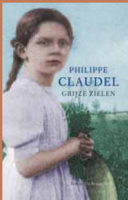
PHILIPPE CLAUDEL, GRIJZE ZIELEN

‘Op een ijzige dag in 1917 wordt het gewurgde lichaam gevonden van de mooie tienjarige Belle de Jour. Jaren later blikt een politieagent uit het Franse stadje terug op deze nooit opgehelderde moord, die ook zijn eigen leven ingrijpend heeft veranderd.’