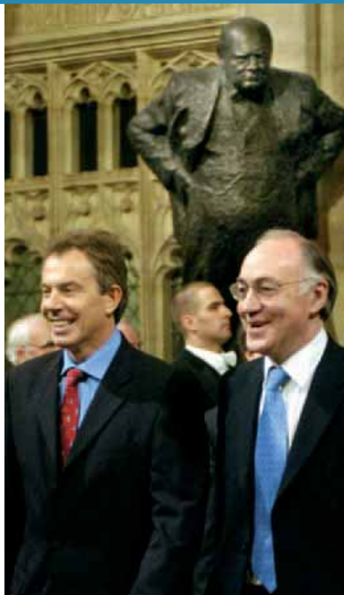
Tony Blair en Michael Howard, oppositieleider

Anthony Charles Lynton Blair (Edinburgh, 1953) had rechten gestudeerd aan die andere beroemde universiteit, Oxford, op het wat behoudende St. John's College, nadat hij op het meer progressieve Balliol was afgewezen. En net als Howard had hij er eigenlijk geen tijd voor. Popmuziek – hij hield van de Rolling Stones en zong in het bandje Ugly Rumours – en vooral politiek hadden zijn warme interesse. Waar Howard uit een familie van middenstanders kwam, daar was bij Blair rechten een familiekwaa: zijn vader (een politicus) en zijn broer waren ook jurist. Hij studeerde met goede, maar door al zijn buitenschoolse activiteiten niet met uitmuntende resultaten af.