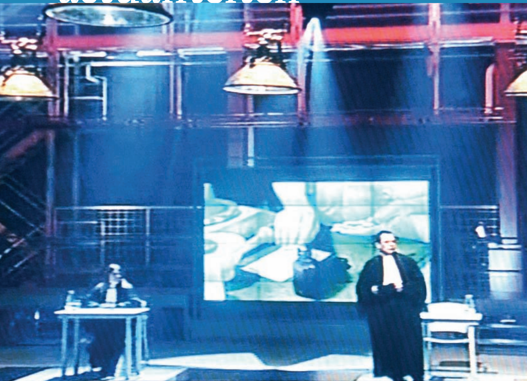
Zestien miljoen rechters

‘Televisie houdt van uitgesproken meningen, en heeft een hekel aan de nuanceringen van een P-G’