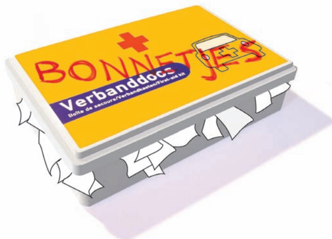
Illustratie: Dimitry de Bruin

Met welke kantoren hij werkt, wil Meijer – ooit whiplashpatiënt – nog niet zeggen. Pas als de samenwerking duurzaam blijkt, komt hij daarmee naar buiten. Een kantoor zou namelijk reputatieschade kunnen oplopen als bekend wordt dat de samenwerking is beëindigd. Vraag Meijer dus