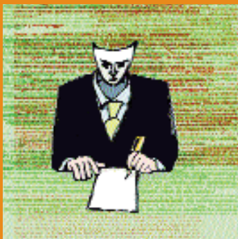
Omslag: Floris Tilanus