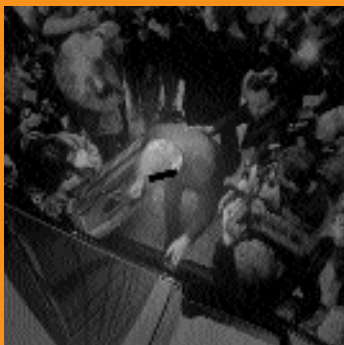
Omslagfoto: 'Businessmen and paparazzi'