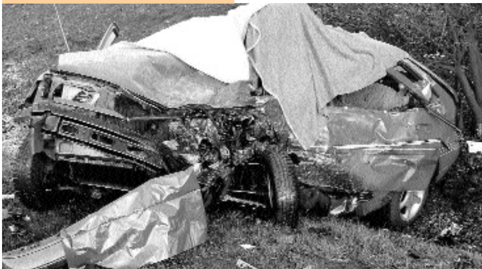
Een van de andere auto's die begin januari betrokken was bij de aanrijding in het Noord-Limburgse Helden