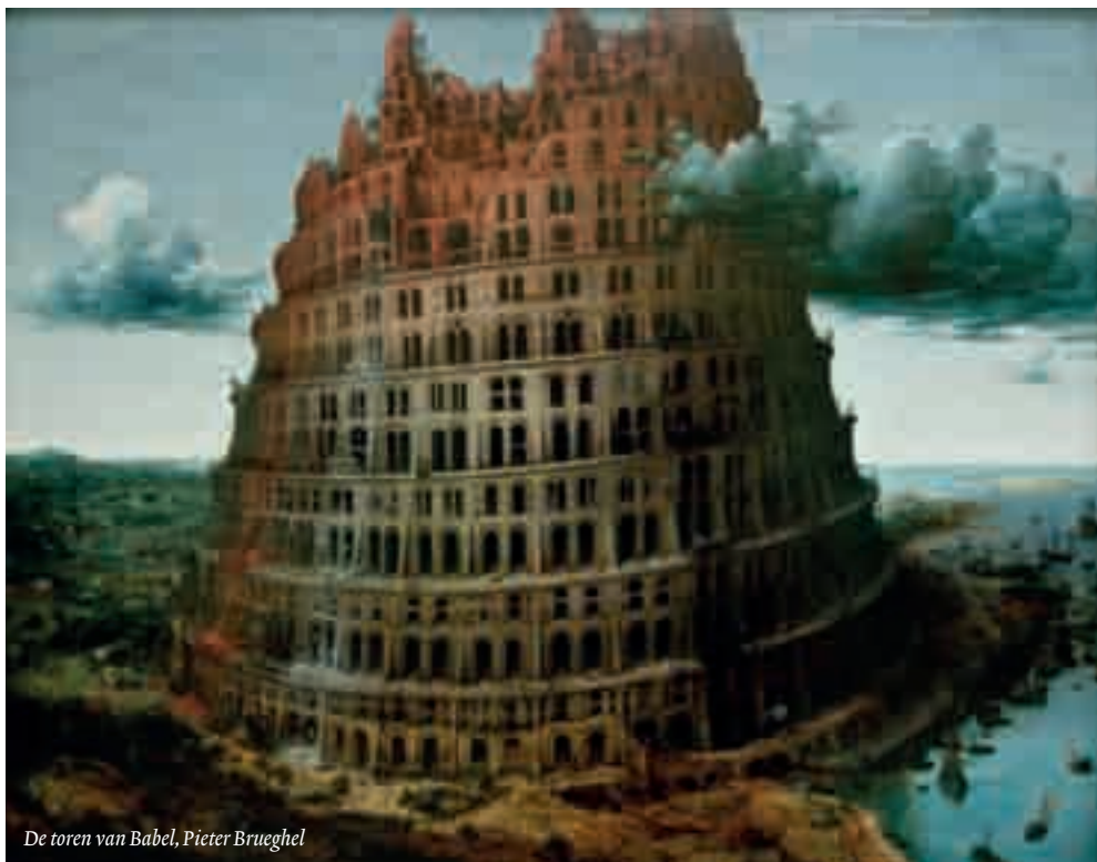
De toren van Babel, Pieter Bruegel