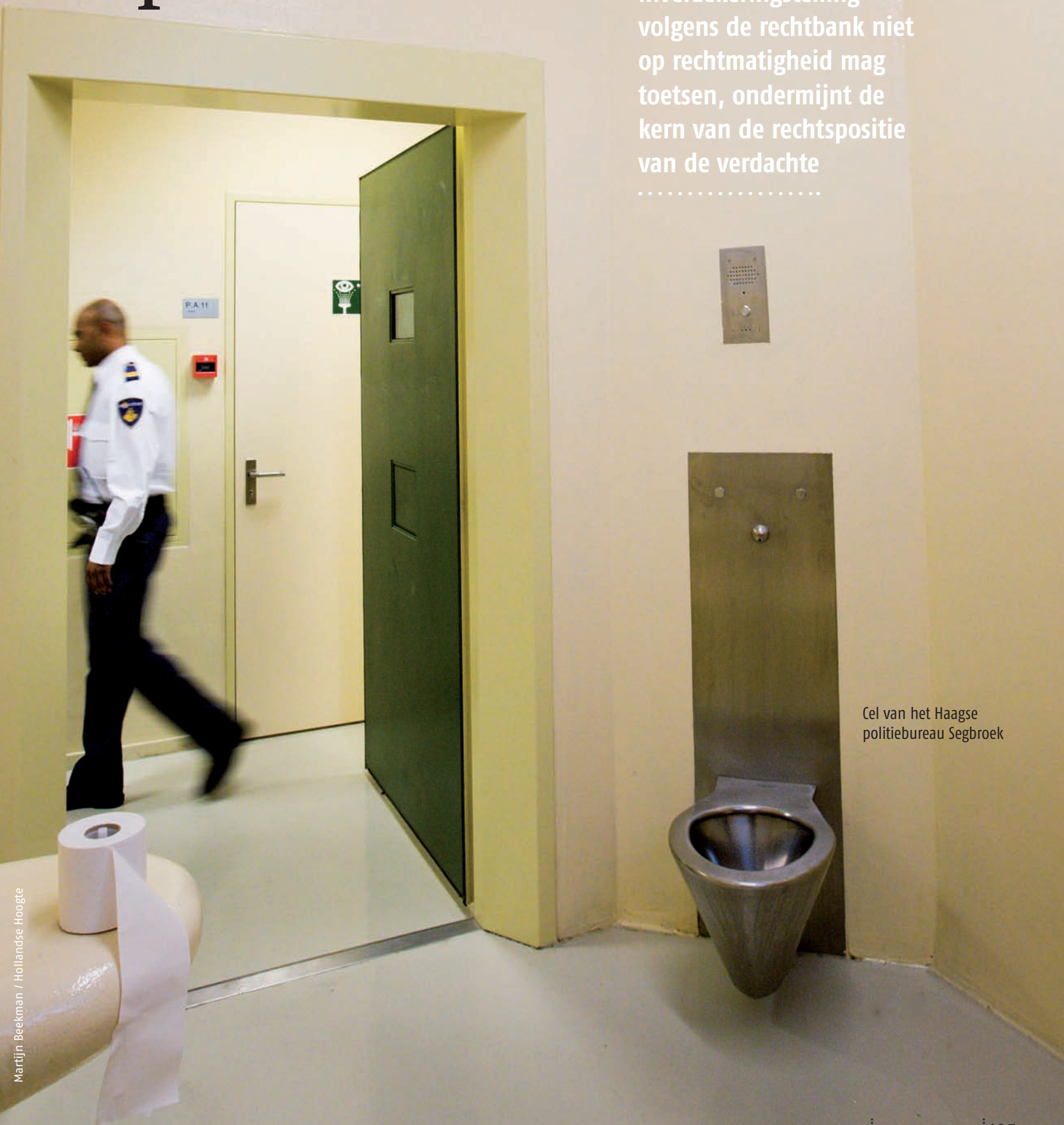
Cel van het Haagse politiebureau Segbroek