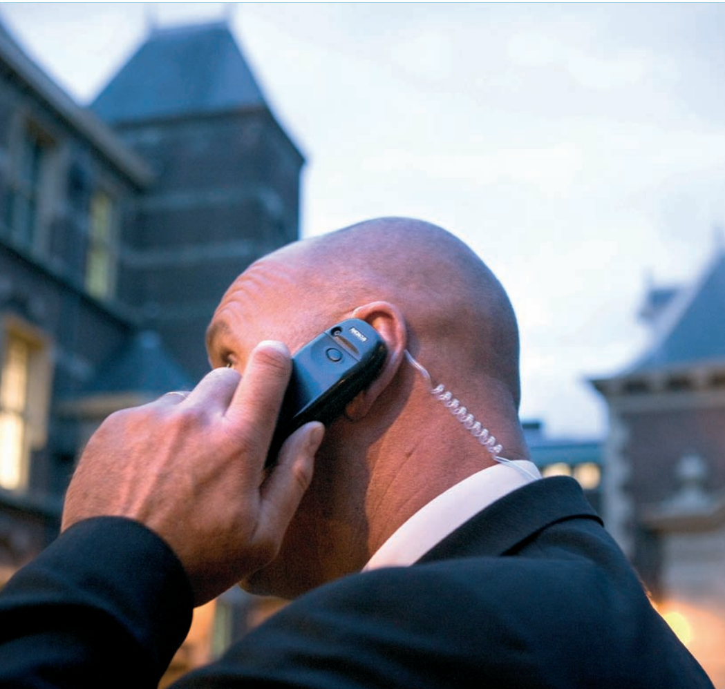
Beveiliging op het Binnenhof (november 2005)

‘uit feiten en omstandigheden blijken van een redelijk vermoeden van schuld’. Wel zou het een probleem kunnen zijn dat de feiten en omstandigheden niet ‘hard’ en niet of nauwelijks toetsbaar zijn, en daardoor niet ‘capable of satisfying the Court’. Dat zou het geval kunnen zijn met geheime dienst-informatie.