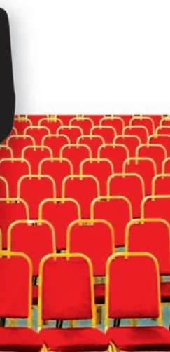
Illustratie: Dimitry de Bruin

Orwell? Kom, kom, dat was ook maar een mening. En geef toe hoe prettig het is als zo’n ongemaneerde loebas op je af dreigt te springen, zich op het laatst bedenkt en wegblijft of onder je ogen elektronisch gecorrigeerd wordt. Nou? Ik ben voor de vooruitgang!