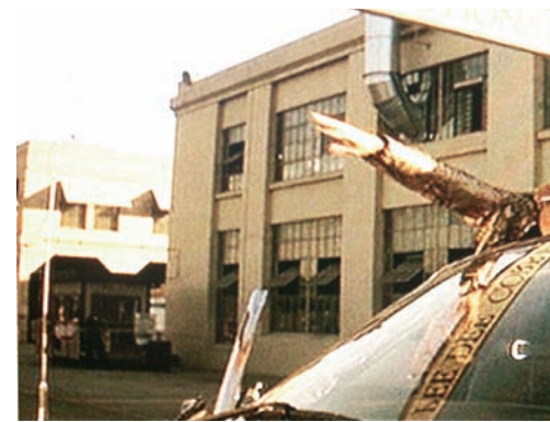
Aan het eind van de film Wild at Heart van David Lynch (1990) wacht Lula (Laura Dern) op Sailor (Nicolas Cage), als hij na een jarenlang verblijf de gevangenis verlaat.