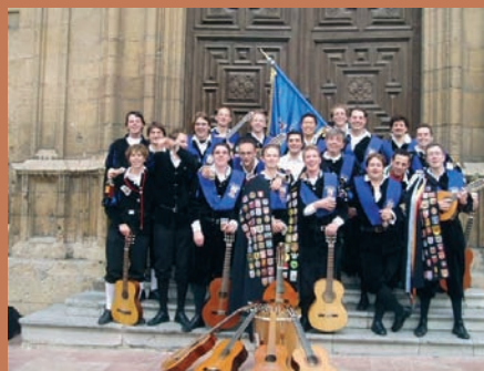
De groep Tuna Universitaria de Maastricht, tijdens het Tuna Festival in Oviedo, Spanje

Ons repertoire heeft zijn oorsprong in Spanje en Midden- en Zuid-Amerika. Het zijn uiteenlopende feestelijke nummers, vaak pasodobles en romantische serenades. Soms zijn ze overgenomen van bekende musici, zoals van Los Panchos een bekende Mexicaanse groep die liefdesliederen zingt. Tijdens optochten spelen we vooral vier-