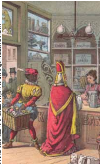
Bron: Jan Schenkman, Sint Nicolaas en zijn knecht . J. Vlieger, Amsterdam circa 1907

gen op tegen Zwarte Piet: de figuur is discriminerend, betogen de protestanten. In 2013 leidt de weerstand tegen Piet tot een rechtszaak. Voor de 75ste Amsterdamse intocht in 2013 wordt een vergunning verleend. 21 bezwaarschriften komen daarop binnen en de burgemeester van Amsterdam verklaart deze allemaal ongegrond; er is geen