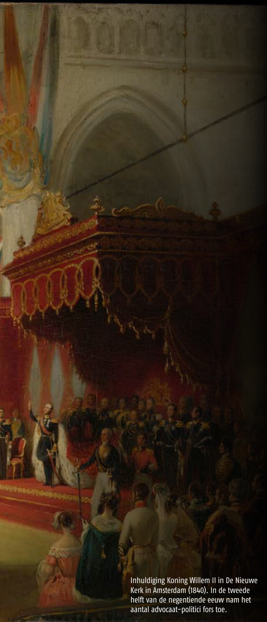
Inhuldiging Koning Willem II in De Nieuwe Kerk in Amsterdam (1840). In de tweede helft van de negentiende eeuw nam het aantal advocaat-politici fors toe.

Vraag iemand hoeveel notarissen hij kent in de politiek, en het blijft lang stil. Artsen in de politiek? Een paar misschien. Dan advocaten. Als er één beroepsgroep goed vertegenwoordigd is in de Nederlandse politieke arena, is het de advocatuur. Van VVD'er Frits Korthals Altes tot PvdA'er Eberhard van der Laan, van de liberaal Johan Rudolf Thorbecke tot CDA'er Dries van Agt: (ex-)advocaten hebben door de eeuwen heen een groot stempel gedrukt op onze politieke besluitvorming.