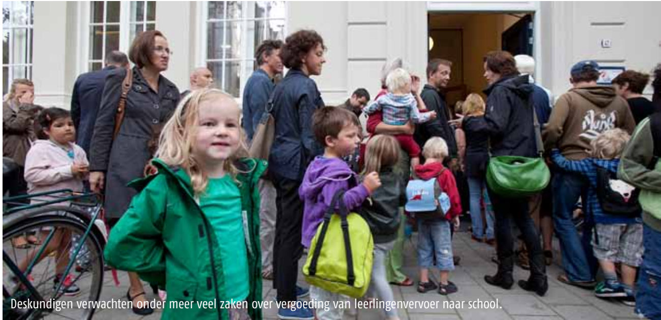
Deskundigen verwachten onder meer veel zaken over vergoeding van leerlingenvervoer naar school.