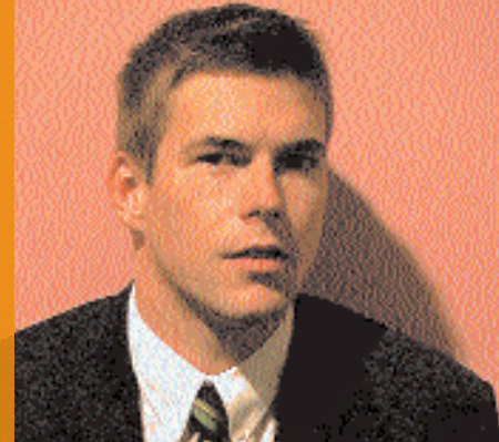
Van Merwijk: 'Mijn cliënt eet eerst in Alkmaar en dan weer in Den Haag, hij heeft zestien openstaande zaken in verschillende arrondissementen'