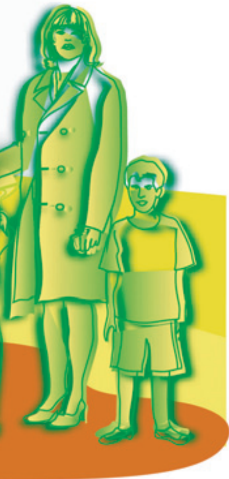
Illustratie: Nadia Gonzalez

de behoefte. Daarbij werd aangeknoopt bij de helft van het voormalig nettogezinsinkomen, waarop kosten van kinderen in mindering zijn gebracht, vermeerderd met 20% (omdat het leven van een alleenstaande duurder is) en vervolgens gedeeld door 2. Per saldo zou de alimentatiegerechtigde dus behoefte hebben aan 60% van het voormalig nettogezinsinkomen, exclusief kosten kinderen.