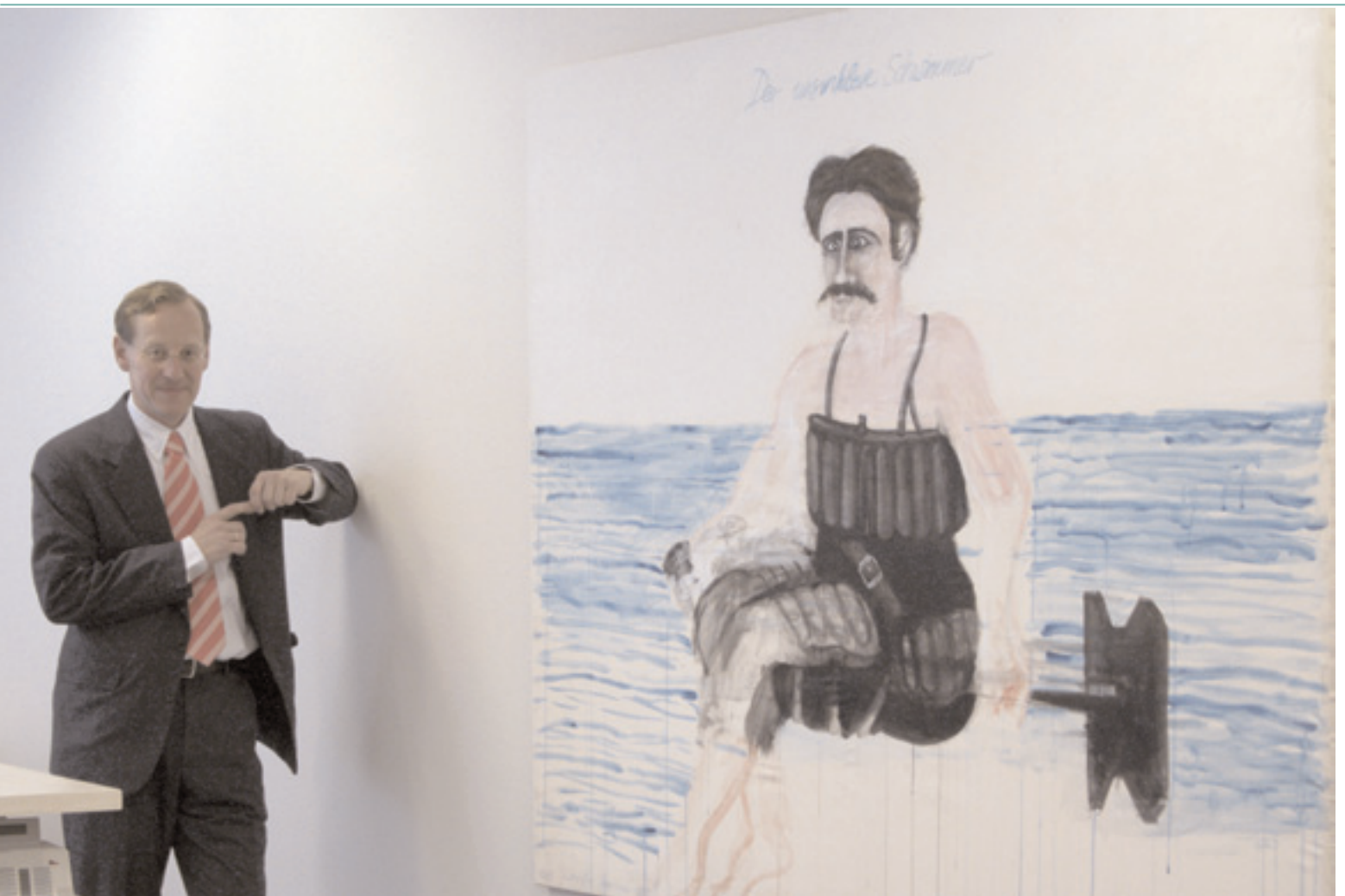
'Het schilderij symboliseert voor mij de cliënt die zegt te geloven in zijn vindingen, terwijl je aan zijn gezicht ziet dat dat geen onvoorwaardelijk geloof is'