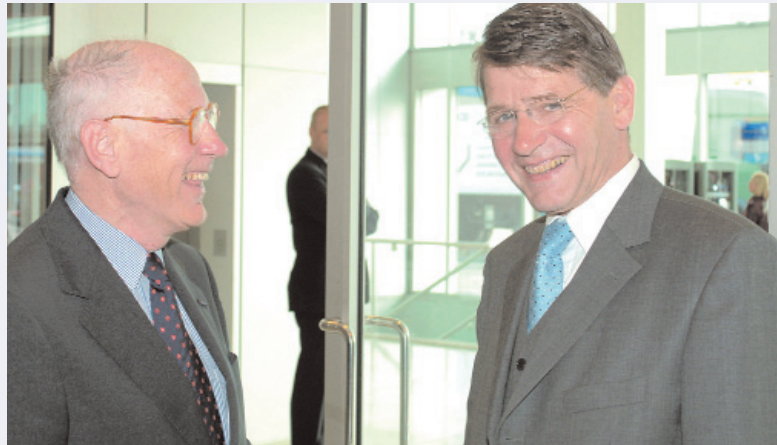
President Haak van de Hoge Raad en minister Donner in het RAI-gebouw

Een gedegen antwoord op deze overzichtelijke vragen draagt onwillekeurig een karakter dat de