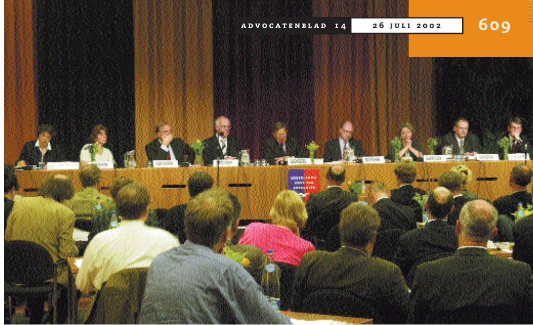
Huishoudelijke vergadering in Utrecht bijeen

allereerst tot het kantoor van de eigen advocaat wenden, kon De Vries zich echter goed vinden. Het zou immers 'niet meer dan normaal' moeten zijn dat mensen een probleem eerst bepreken met wie ze dat probleem hebben.