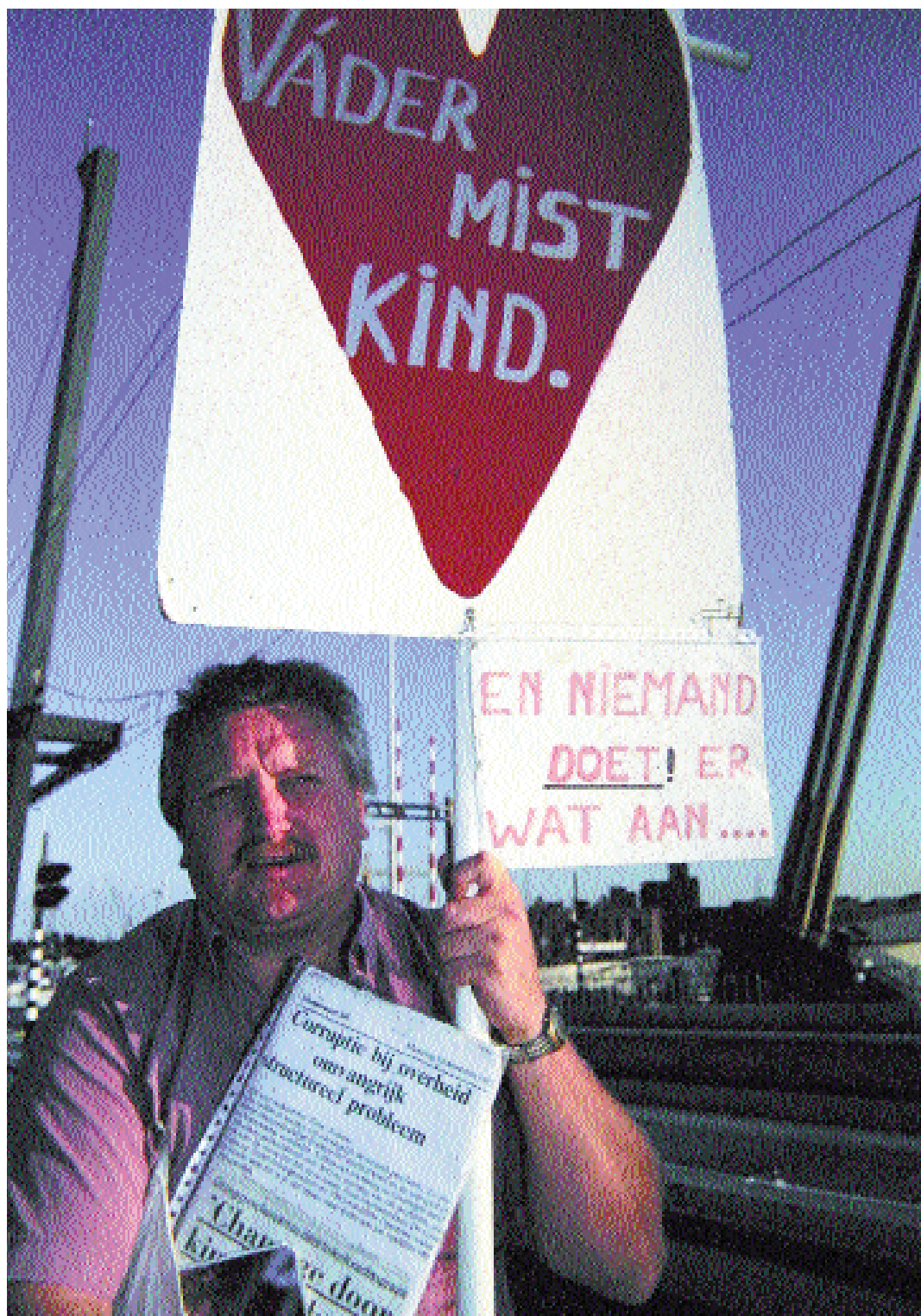
Rotterdam, 1997: Gescheiden vader in actie