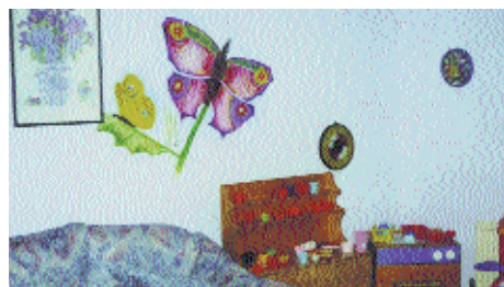
Het omgangshuis, 'Accord Centre', in London

In hoeverre de omgangshuizen in Engeland en Frankrijk resultaat boeken, is nog niet bekend. Uit Canadees en Australisch onderzoek is al wel gebleken dat wanneer een familie gebruik maakt van een